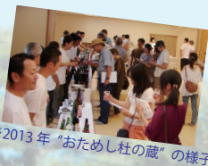
※2013年“おためし杜の蔵”の様子