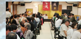
※2013年“じっくり杜の蔵”の様子